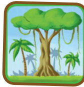
Leeft in de jungle