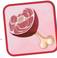
En is een vleeseter